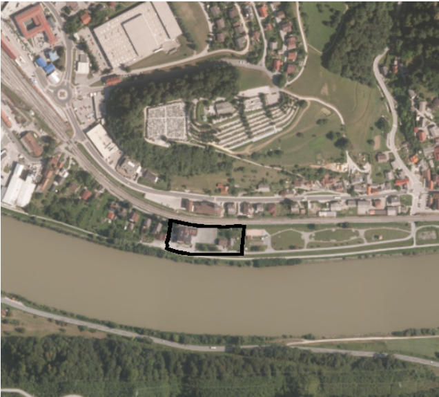
Slika: prikaz območja OPPN na digitalnem ortofoto posnetku

Območje OPPN je velikosti ca. 60 ara in zajema naslednja zemljišča s parcelnimi številkami: 259/2, 259/3, 259/4, 259/5, 259/6, 259/7, 262/1, 264/1, 264/2, 266/1, 266/3, 270/4, 273/6, 273/15, 1520/113, 1520/114 in 1521/28, vse k.o. Sevnica (1379).